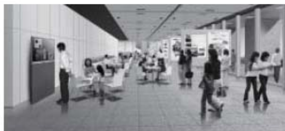
▲区民ホール(ギャラリー利用)