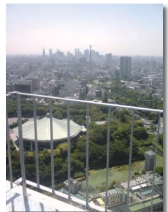
千代田区役所屋上より

本格的に議会も経験し様々な仕組みを勉強して行く中、しっかりとした気持ちで真剣に対処し、よりよい千代田を目指して行きたいと思います。これからも皆様の暖かいご指導ご鞭撻の程、よろしくお願いいたします。