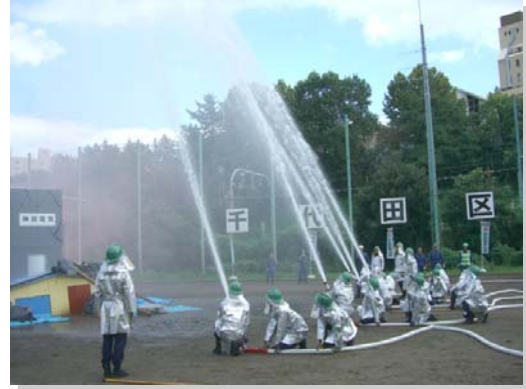
消防団合同点検（外濠グラウンド）

消防団を取り巻く環境の変化の中、地域の防災リーダーとしての役割がおおきくなっています。団員不足が言われていますが、各団長を中心に団員方の仕事を持ちながらの活動には、感謝するしだいです。より実りのある答申になるよう会議が続けられ、来月最終的に答申が示される見込みです。