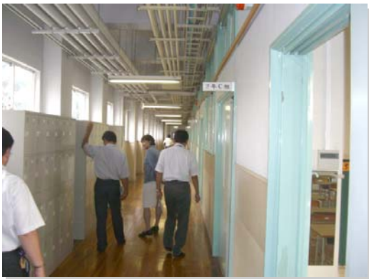
麹町中学校 仮校舎視察（旧永田小学校）