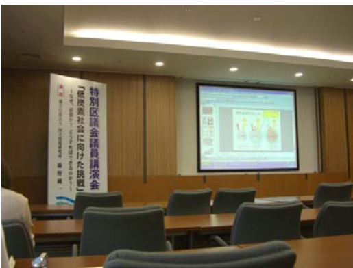
特別区議会議員講演会「低炭素社会に向けた挑戦」