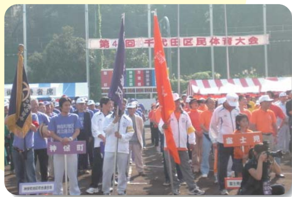
千代田区民体育大会