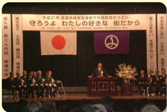
全国地域安全運動千代田区民のつどい

1件、補正予算1号と平成20年度決算認定が上程されました。「新型インフルエンザ対策」「新保健所施設整備」「九段中等教育学校仮校舎整備」の補正予算3本は可決されましたが、20年度決算は継続審査となりました。会期延長を図っても審査すべきとの立場をとりましたが、少数ということで継続が決められました。また、子育て世代の教育委員が決まり、約1年間空席になっていた教育長も決められました。教育行政は次世代を育てる大切なもの、新教育長、教育委員会には今まで以上に機能を発揮してほしいと思います。その他「区長、副区長、教育長の給与、旅費、退職手当」の一部を改正する条例は継続審査となり、「富士見子ども施設整備計画に係る特定事業契約の一部変更について」は可決されました。これは、屋上プールに屋根をつけ、太陽光パネルを整備し、プールの水の加温設備など追加に伴う契約変更を認めるものです。他に「新型インフルエンザ対策の強化を求める意見書」「警察官の増員を求める意見書」などが可決されました。